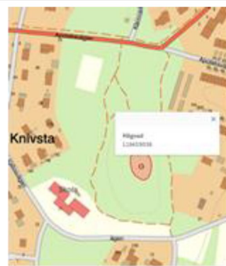
Figur 1: Placering av fornlämning. Källa: Fornsök 2023-03-13.

Beskrivning På ett avstånd om knappt 100 meter från föreslagen placering av byggnad finns en fornlämning. Fornlämningen (L1943:9538) utgörs av en hägnadsvall, vilken är cirka 30x23 meter stor enligt beskrivning i kulturmiljöregistret. Den intill tre meter breda vallen, vilken troligen är en utrasad mur, består av 0,2–0,8 meter stora stenar, ibland större. Anläggningen är udda till sin karaktär med otvetydigt ålderdomlig. Den uppfyller kulturmiljölagens alla grundläggande rekvisit för att bedömas som fornlämning.