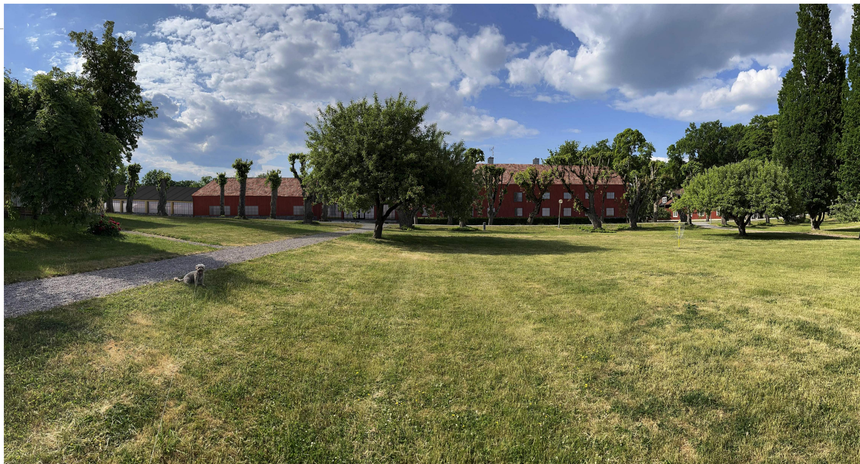
VY FRÅN PARKEN EFTER