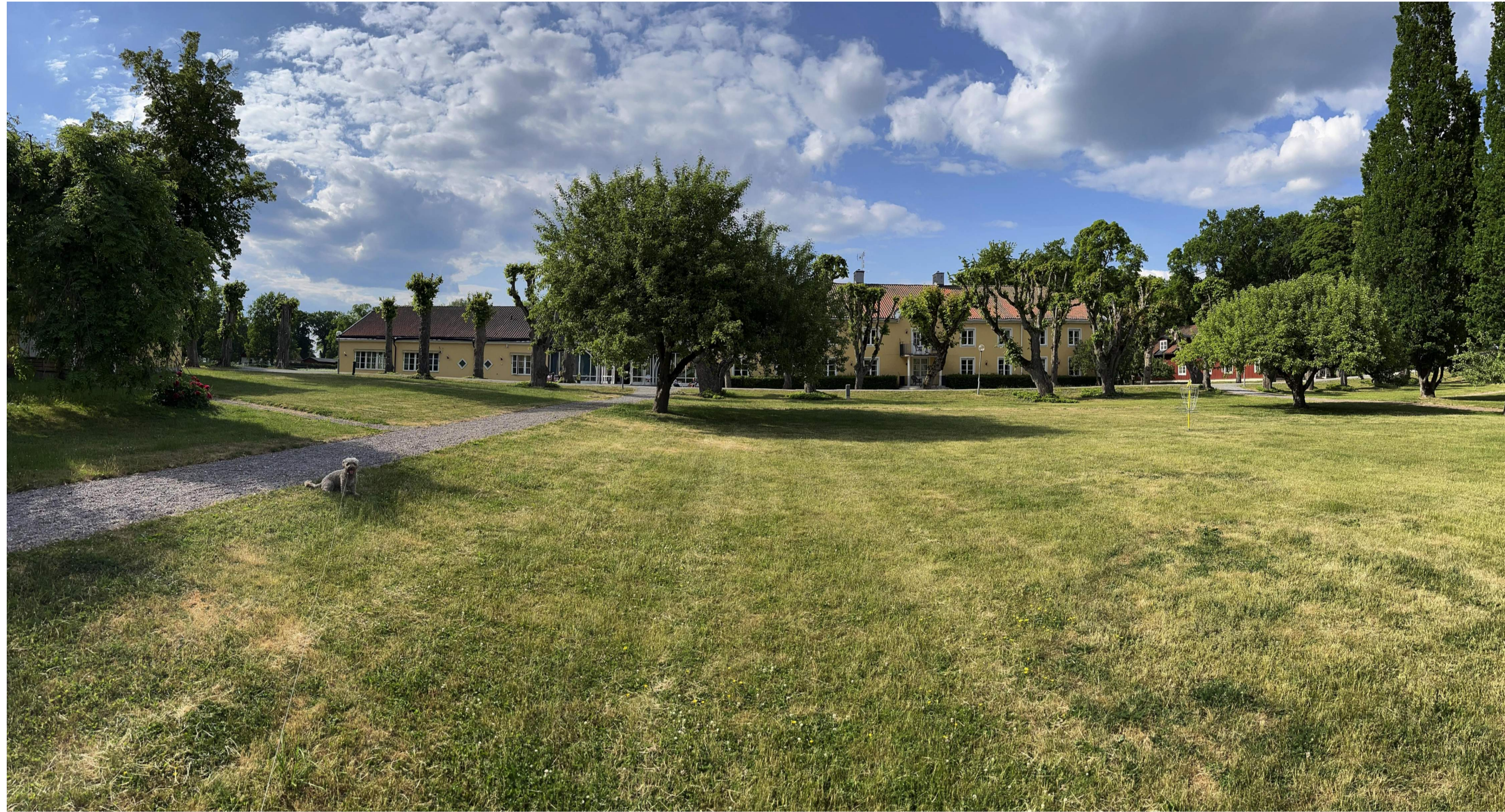
VY FRÅN PARKEN FÖRE

OBS! Endast illustrationer. För exakt utförande och position se ritningar.