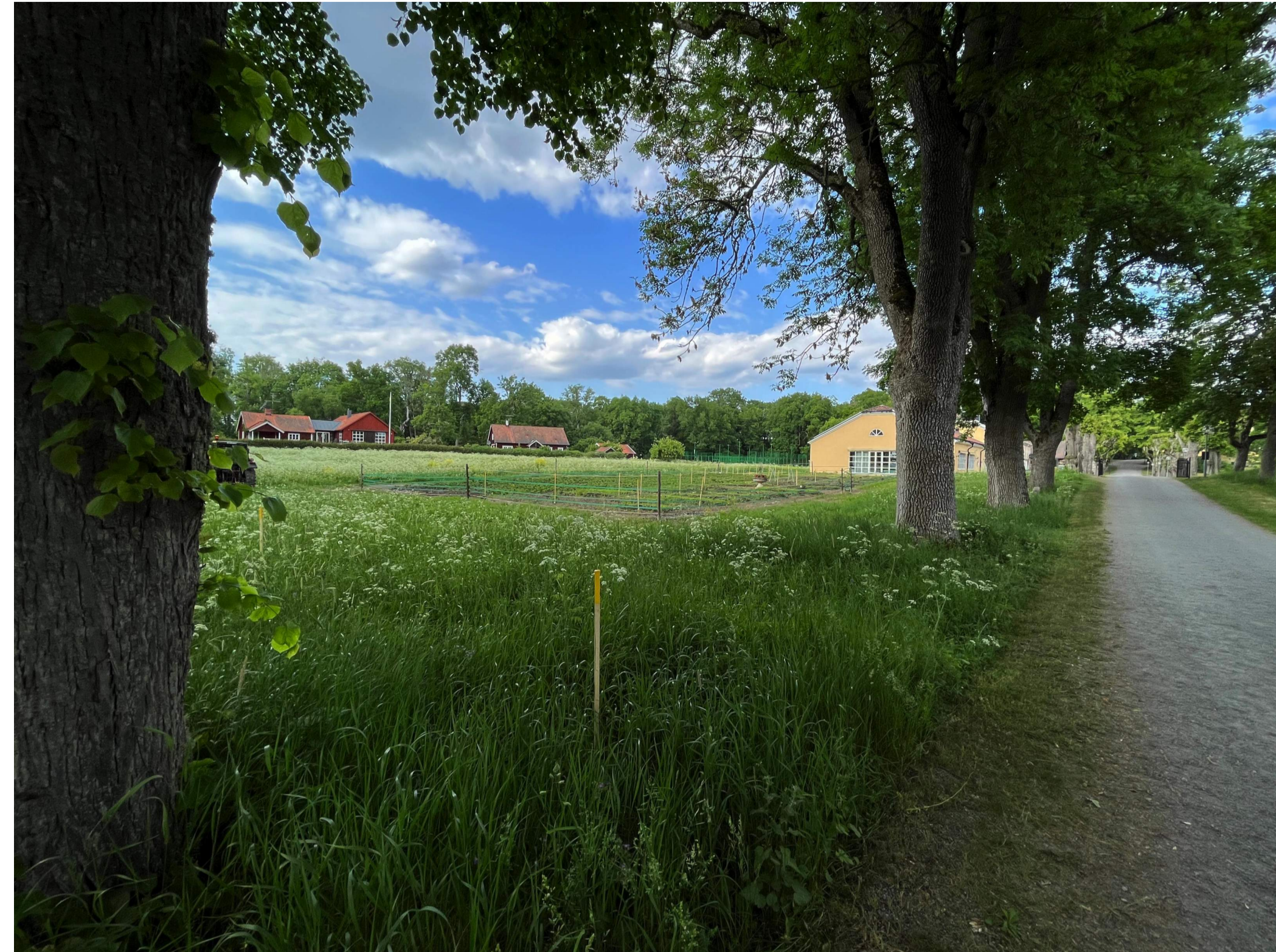
VY FRÅN SÖDER FÖRE