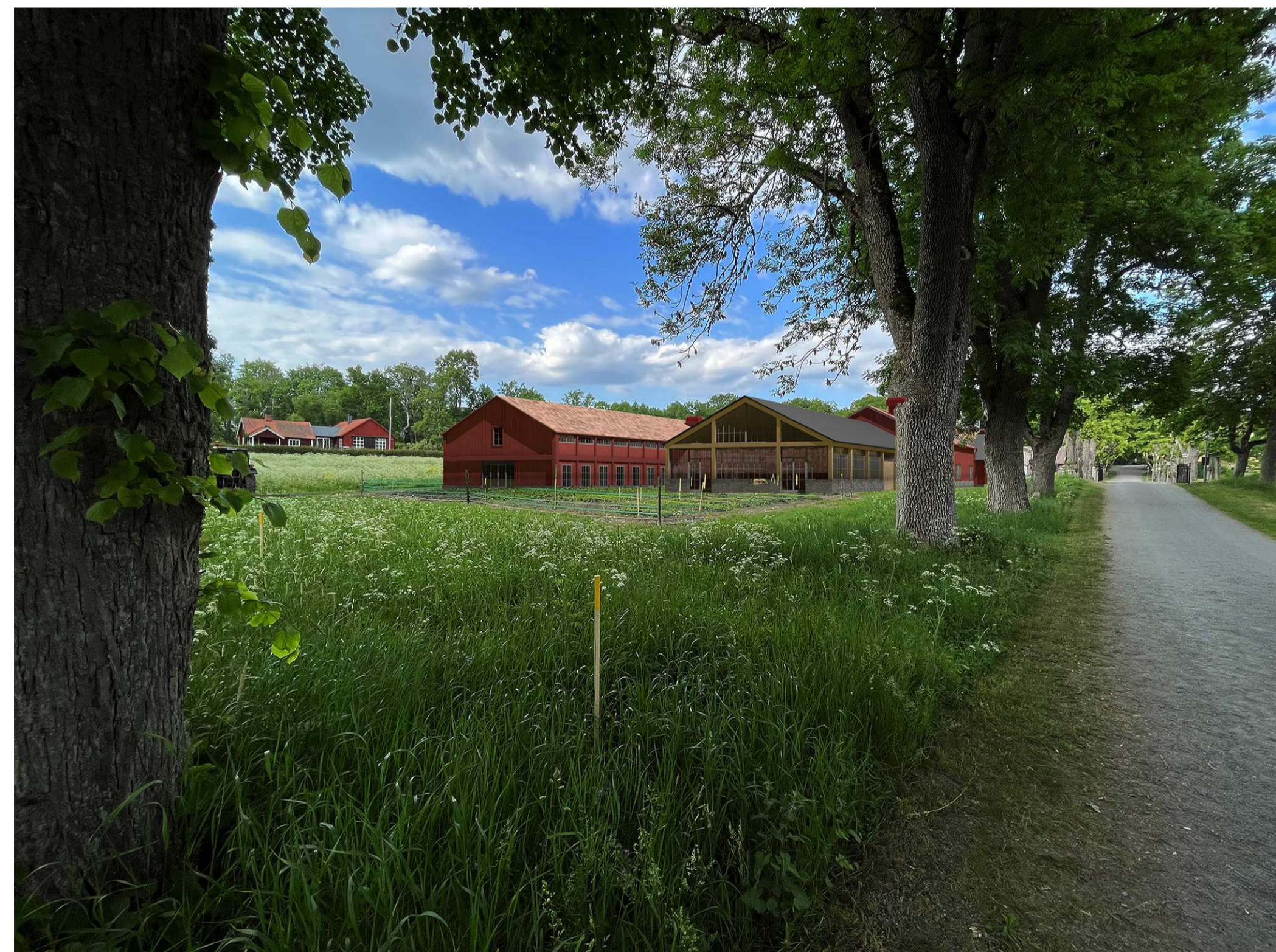
VY FRÅN SÖDER EFTER