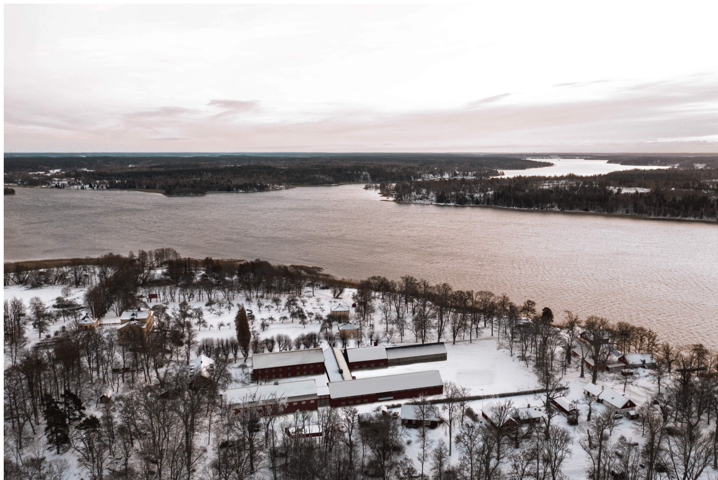
FÅGELVY 2 FÖRE