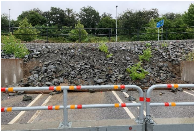
Parkering mot Centralvägen, efter ras

Muren dimensionerades när den byggdes enligt de normer som då rådde, men det är uppenbarligen inte längre tillräckligt, kanske p.g.a. klimatförändringar över tid och därmed ökade nederbördsmängder. När rasen skedde så var det en uppenbar risk för att ytterligare mur skulle rasa. En del av vår parkering var obrukbar och raset i slänten ovanför hotade hållfastheten i cykelbanan både mot Centralvägen och Gredelbyleden.