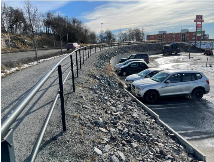
Muren innan ras, mot Centralvägen

Efter ett antal dagars kraftiga regn i augusti 2023 så rasade delar av ICA Kvantum Knivstas parkeringsmur och också del av slänten ovanför. Muren och slänten ligger mot, mycket nära, Centralvägen och Gredelbyleden,