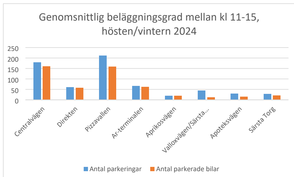
Figur 1: Tabell över genomsnittlig beläggning på parkeringsplatser i Knivsta kommun.

Utöver pendlarparkeringarna är det bara parkeringsytan vid Aprikosvägen som har en beläggingsgrad av sådan nivå att införandet av parkeringsavgift kan anses motiverat. Under dagtid är beläggingsgraden 95% på denna parkering och under kvällstid är den 100%. För övriga parkeringsytor bedöms nuvarande reglering vara tillräcklig för att ordna och styra trafiken.